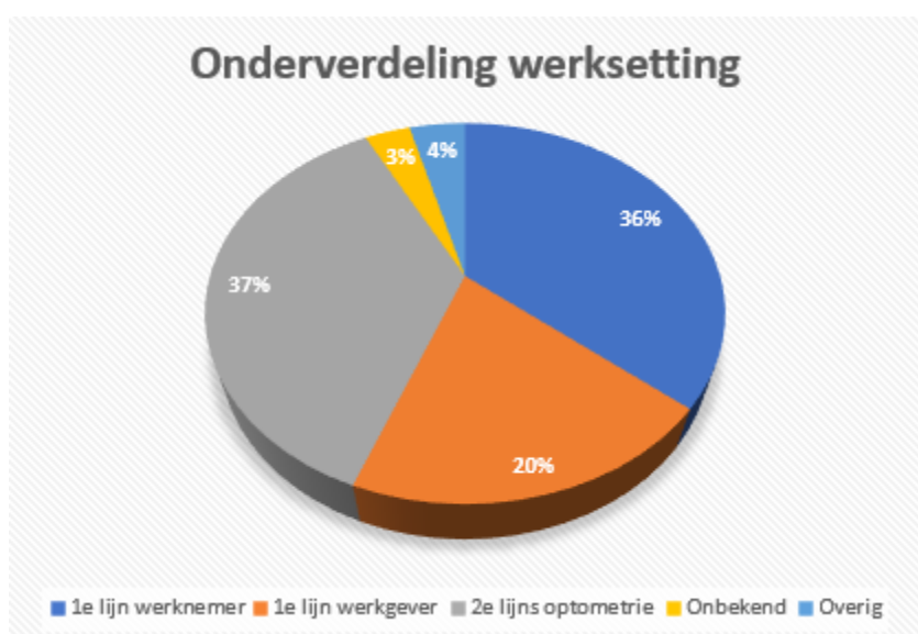
Figuur 2: OVN leden per segment 2024

We streven ernaar om van alle leden de informatie over hun werksetting in de ledenadministratie accuraat te hebben. Hiervoor ontvangen de leden tweemaal per jaar automatisch een bericht om MIJN OVN te controleren en desgewenst aan te vullen.